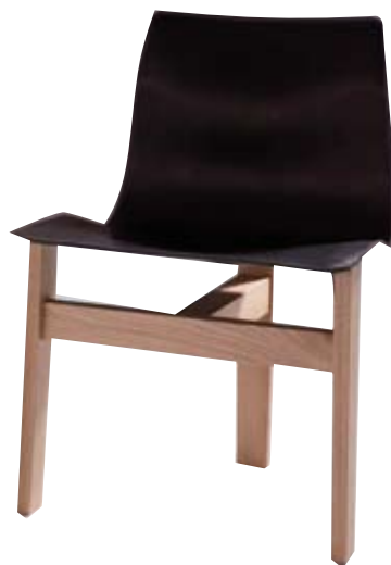
KLASSISCH Mit nur drei Beinen und einem Sitz aus Leder ist er inzwischen ein Design-Klassiker (Tre 3 von AgapeCasa, um 890 Euro, www.agape32.de )

schränk oder Tisch nachdenkt, die auch in ein paar Jahren noch gefallen und Bestand haben, dann sollte man sich auf maximal zwei Farben konzentrieren, am besten auf nur eine Holzart. Wandfarben, Vorhänge, Kissen und Teppiche können verrückt und trendig sein, weil sie leichter und preiswerter zu ändern sind.