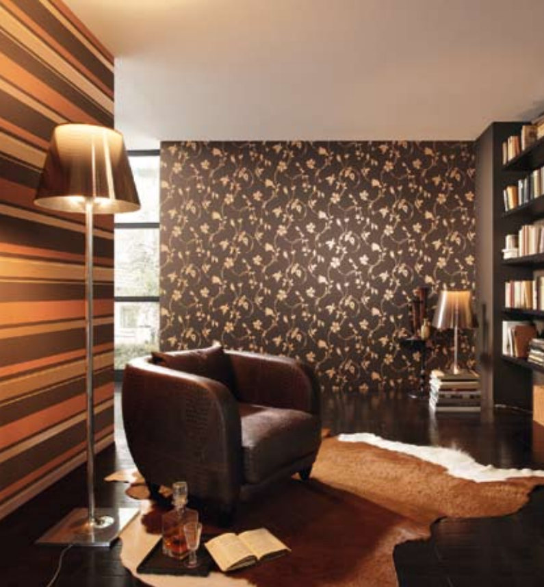
ZUGEWACHSEN Eine Wand aus Blättern schafft diese Vliestapete (aus der Serie New Beats von Rasch, Rolle um 18 Euro, www.rasch.de )