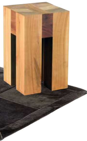
ROBUST Aus Massivholz gefertigt wird dieser Stollenhocker (von Scholtissek, um 440 Euro, www.scholtissek.com )